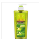
Жидкое мыло для рук кухонное Зеленое яблоко «КУХНЯ РЕКОМЕНДУЕТ»

Возможно, тебе будут интересны следующие товары